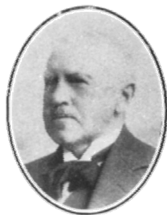
Bror Emil Hildebrand