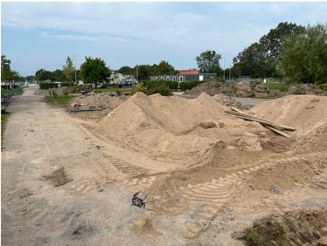
Markarbete och etablering