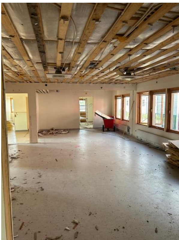
Rivningsarbete Hus C