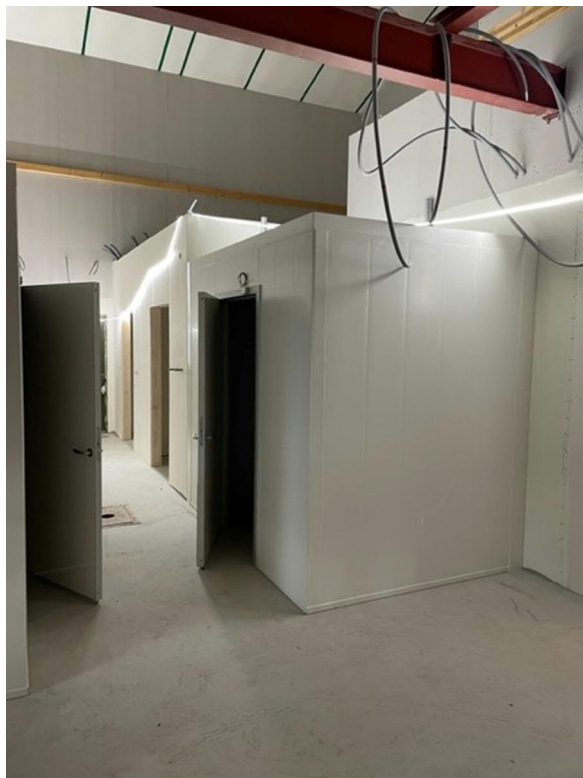
Kyl och frysrum monterat i storköket Hus 1.