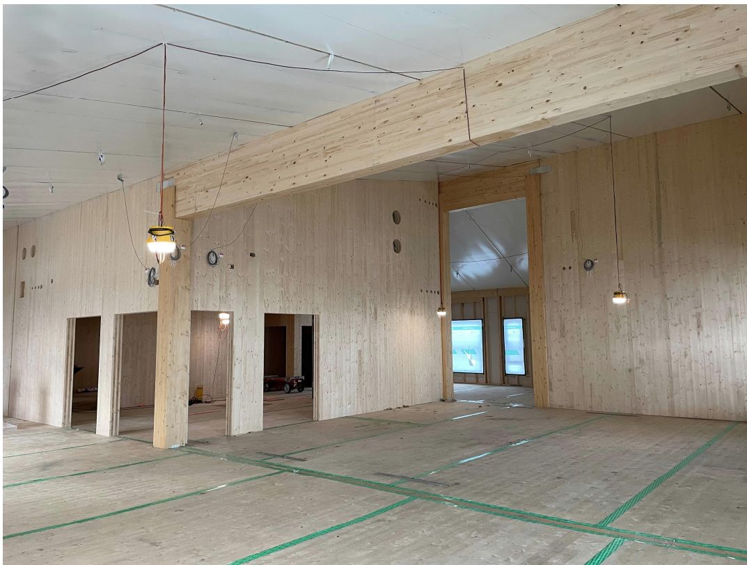
Hus 3 plan 2.