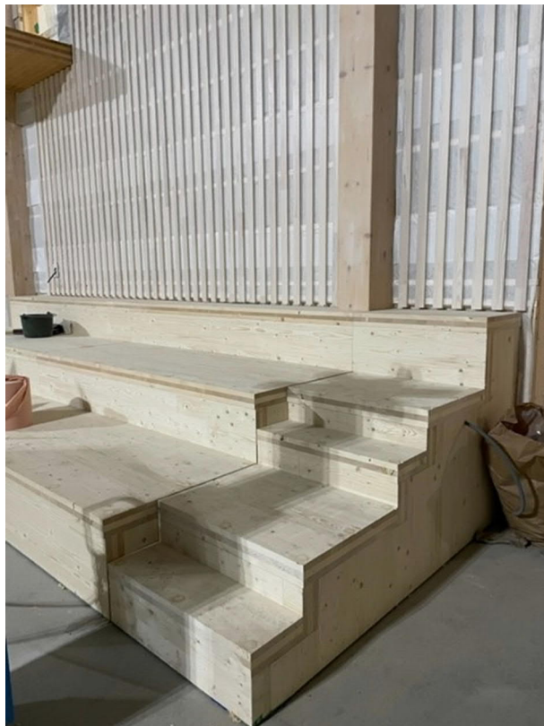
Del av läktaren i idrottshallen.